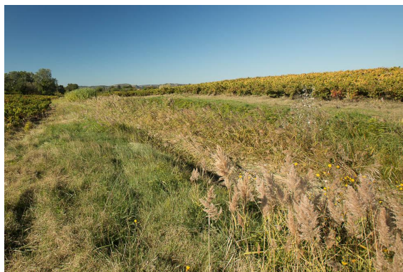
Phragmitaie dans le lit du cours d'eau.