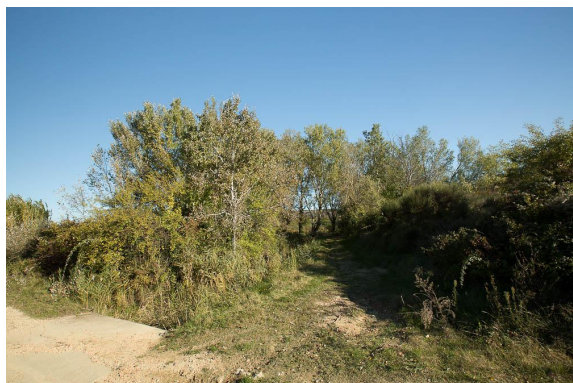
Ripisylve à Peupliers le long du ruisseau, au droit du bassin de décantation.