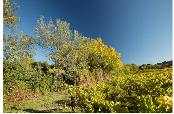
Vue de la ripisylve contrainte, avec Ailanthos (feuillage jaune).