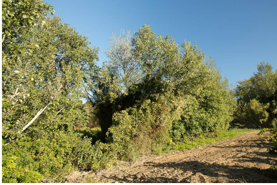
Vue de la ripisylve dans la partie amont, contrainte par le vignoble.