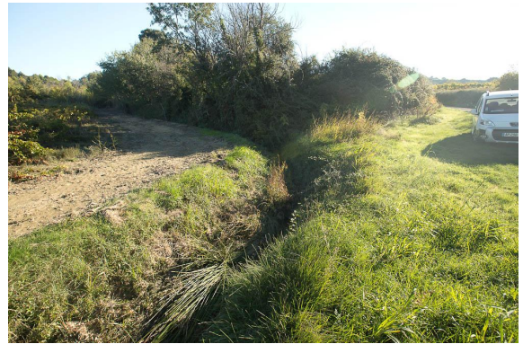
Juste en amont du pont de la fontaine, l'entretien des lieux laisse la place à une végétation plus herbacée.