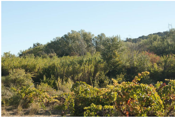
Vigne, Canne de Provence et ripisylve à Peupliers blancs.