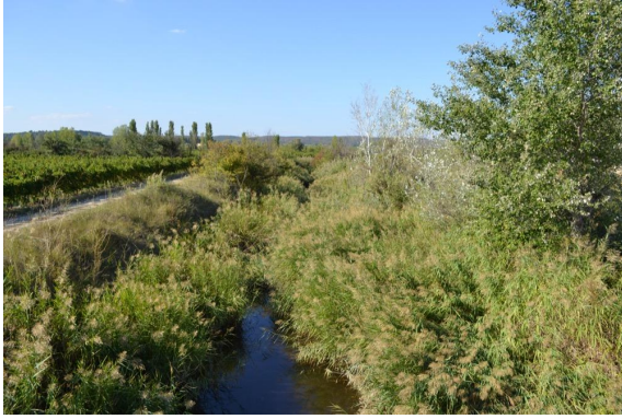
Ruisseau incisé en aval de la RD792.