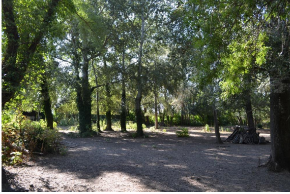
Zone surpâturée par les chevaux.