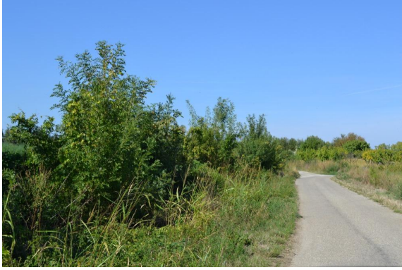
Ruisseau canalisé en bordure de route vers l'île basse.