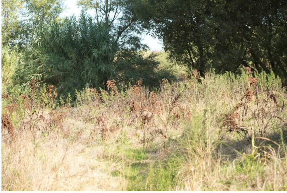
Vue de cette zone humide peu marquée.