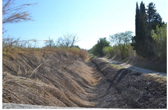
Cannes de Provence sur berges de fossés brûlés.