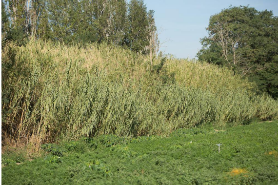
Cannier vu depuis les cultures entre canal et Gardon.