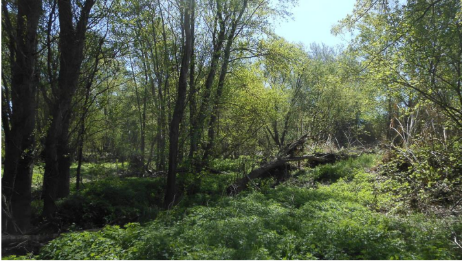
Très belle ripisylve en bord de Gardon.