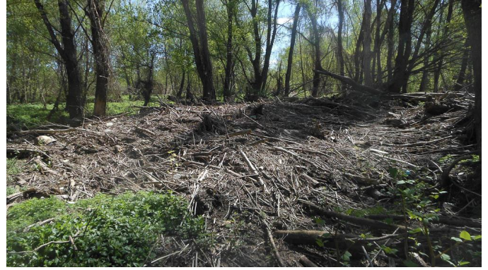
Le rôle de la ripisylve comme peigne à embâcles est ici particulièrement remarquable.