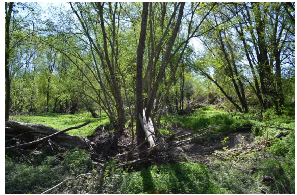
Effet peigne de la ripisylve (rétention d'embâcles).