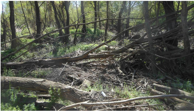
Gros peigne à gros embâcle !