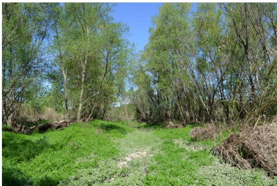
Ripisylve dans un bon état de conservation avec présence de chenaux submergés en période de hautes eaux.