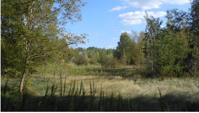
Ripisylve en cours de colonisation.