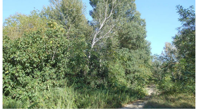
Ripisylve dominée par les Peupliers et les Frênes.