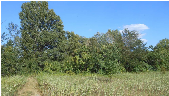
Ripisylve dominée par les Peupliers et les Frênes.