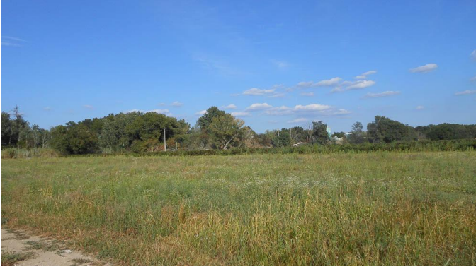
Ripisylve et structures d'exploitation de grave.