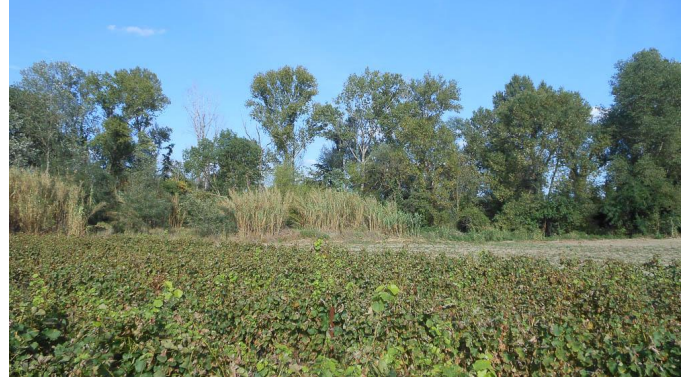
Les Cannes de Provence profitent d'une trouée.