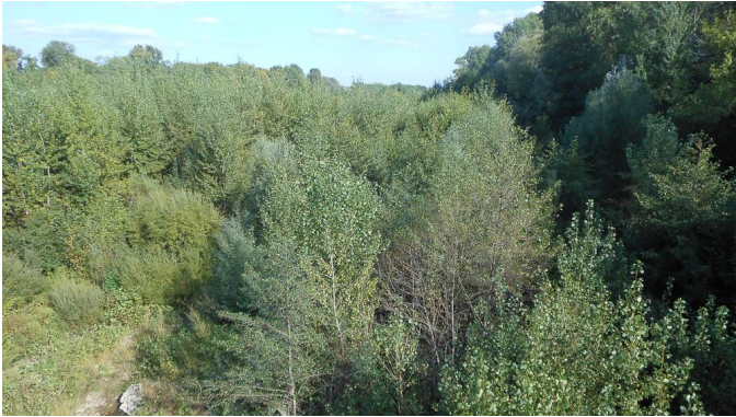
Hors zonage : dans le lit du Gardon, les Peupliers grandissent et tendent à élargir la ripisylve.