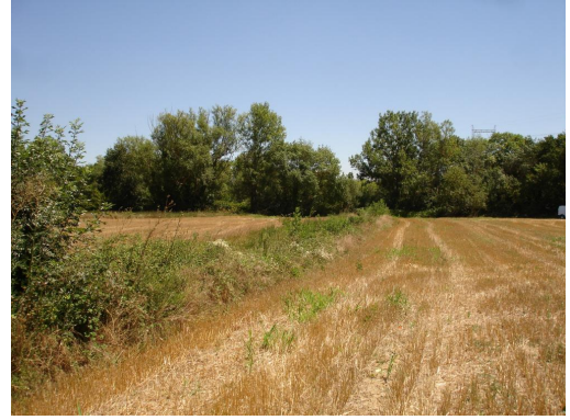
Ripisylve éparses en bordure de fossé en limite de terres cultivées.