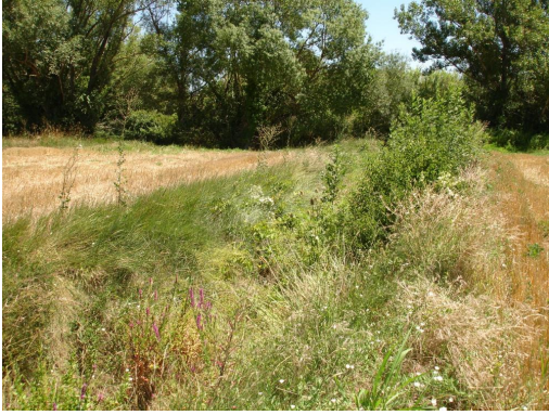
Ripisylve éparses en bordure de fossé.