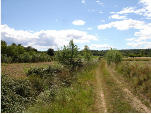
Ripisylve installée en bordure de fossé enrichi.