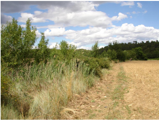
Ripisylve continue sur bordure de fossé vers Plaine verte.