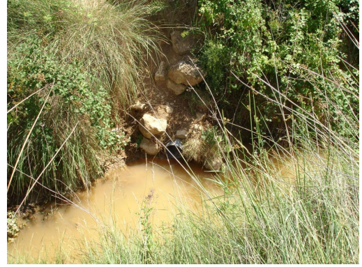
Drains en sortie de vigne entre Robiac et la Plaine verte.