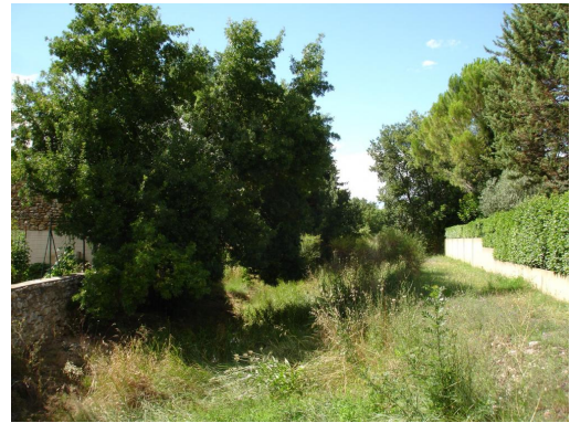
Lit du cours d'eau vers le pont de Groupeyre.