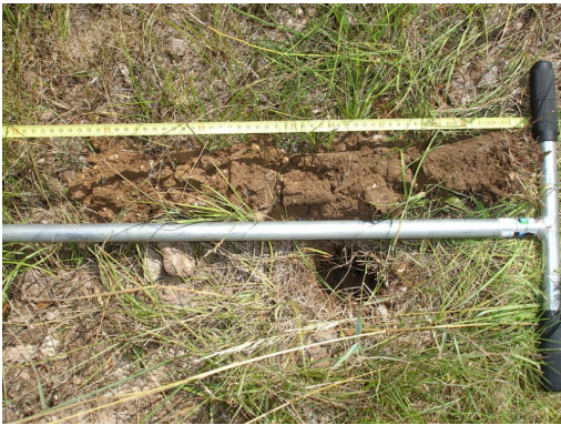
Colluviosol sans traces d'hydromorphie dans le 50 premiers cm - sondage négatif.