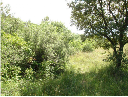
Ripisylve dominée par les Frênes vers les Cambons.