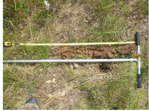
Colluviosol sans traces d'hydromorphie dans le 50 premiers cm - sondage négatif.