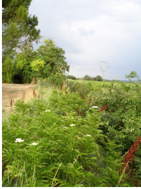
Ripisylve discontinue sur cours d'eau incisé et canalisé en aval de l'Oule.