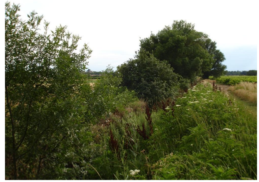
Ripisylve discontinue sur cours d'eau canalisé et incisé.