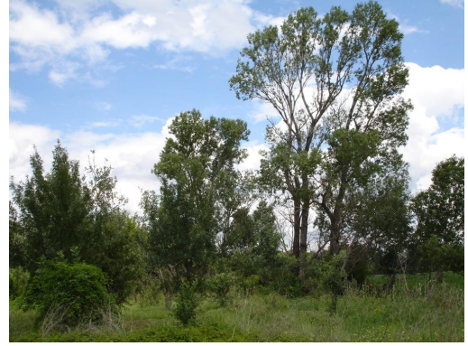
Colonisation par les Frênes et les Peupliers.