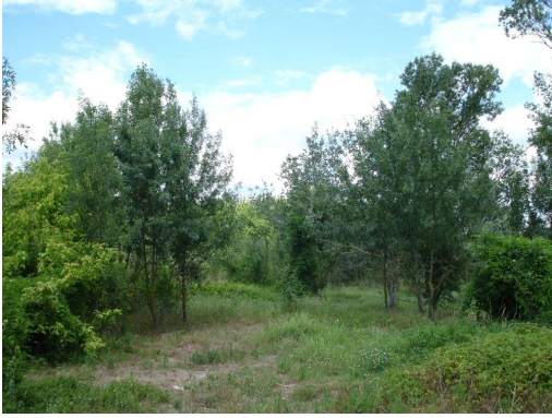
Bosquet de ripisylve dominé par les Frênes et les Peupliers.