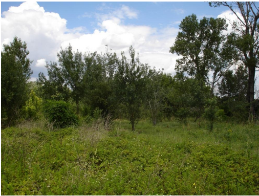
Bosquet pâturé par des chevaux.