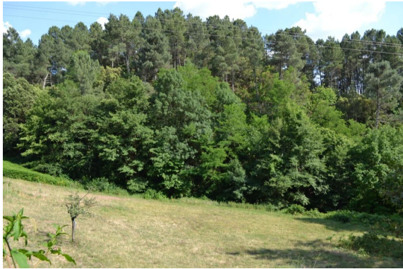
Ripisylve continue en limite de prairie mésophile pâturée en amont du village de la Lassalle.