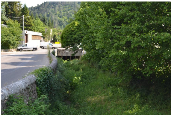
Ripisylve le long de la D153 à l'entrée du village de Lasalle.