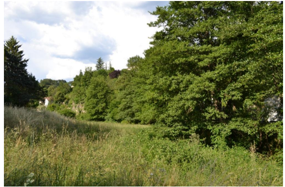
Ripisylve continue dans prairie pâturée en amont du village de Lasalle.