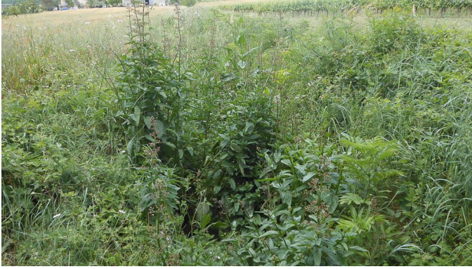
Vue de la partie aval du fossé végétalisé Ici Scrophularia auriculata.