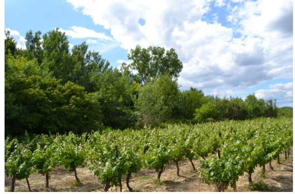
Ripisylve dominée par les Frênes et les Peupliers.