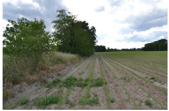
Cordon de ripisylve discontinue en limite de terres cultivées.