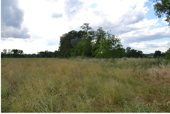
Ripisylve en limite de terres cultivées sur talus avec Peupliers et Frênes.