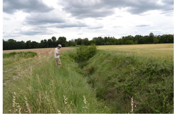
Fossé profond avec ripisylve épars et enrichie vers le Moulin de Baguet.