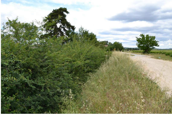
Ripisylve en aval de la voie communale vers le Moulin de Baguet.