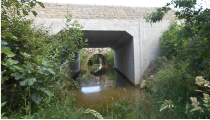
Ponts supportant l'ancienne voie ferrée et la route, sur le cours d'eau.