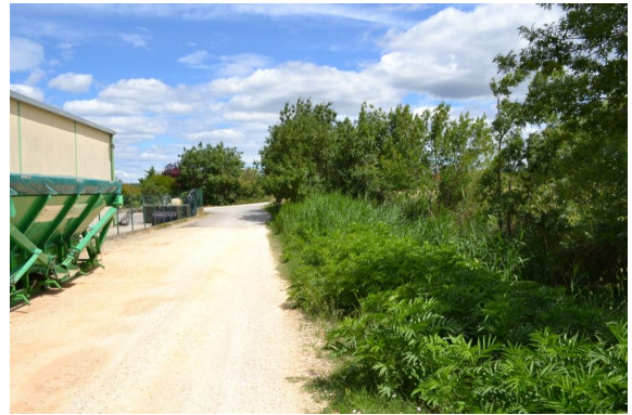
Ripisylve discontinue vers la coopérative agricole.