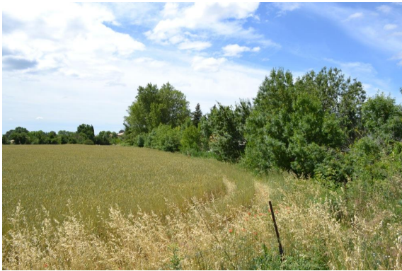
Ripisylve continue en bon état en aval de l'ancienne voie ferrée.