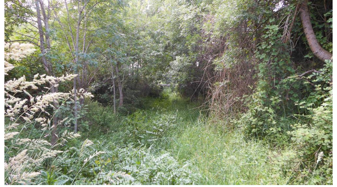
Vue du cours d'eau très végétalisé depuis le pont de la voie ferrée.