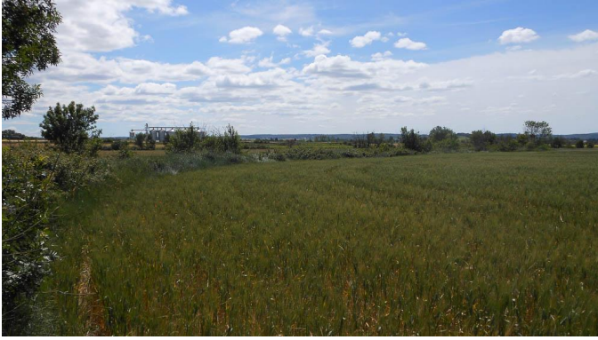
Ripisylve discontinue sur fossé agricole.