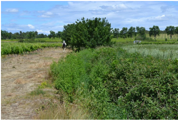
Ripisylve sur fossé enrichi vers les Maillets.