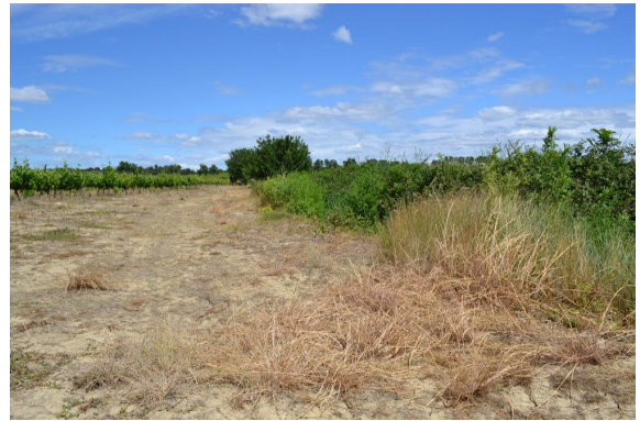
Traitements phytosanitaires en bordure du fossé.