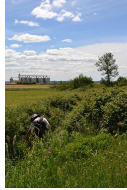
Fossé très incisé et enrichi vers les Maillets.