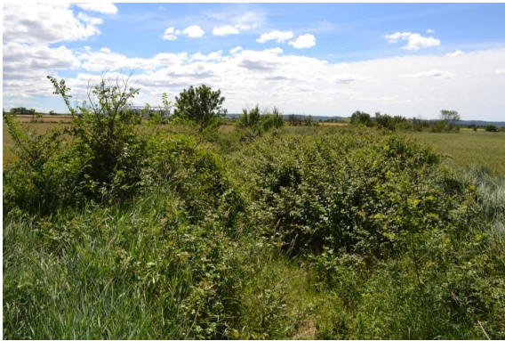
Fossé enrichi vers les Maillets.