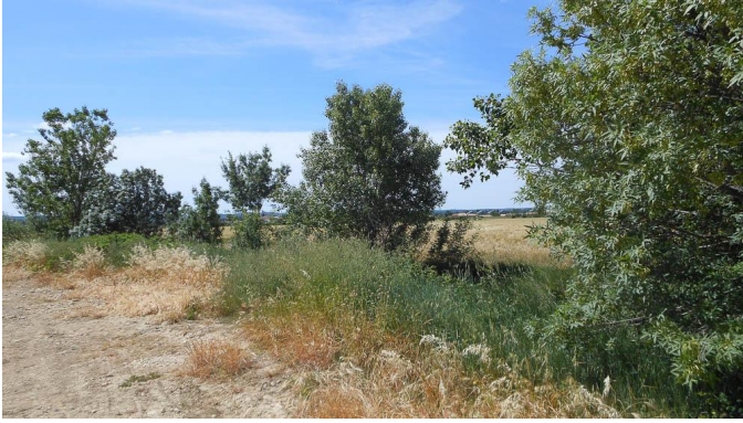
Ripisylve discontinue, en contexte agricole avec traitements phytosanitaires.