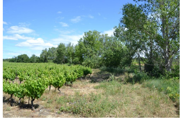
Ripisylve continue vers les Gorges.