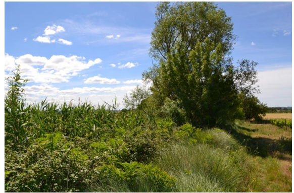
Ripisylve continue sur fossé canalisé vers les Gorges.