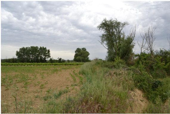
Ripisylve dégradée vers Joncas.