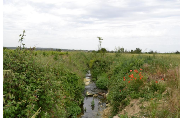
Ripisylve relictuelle sur fossé incisé vers le Moulin de Reboulet.