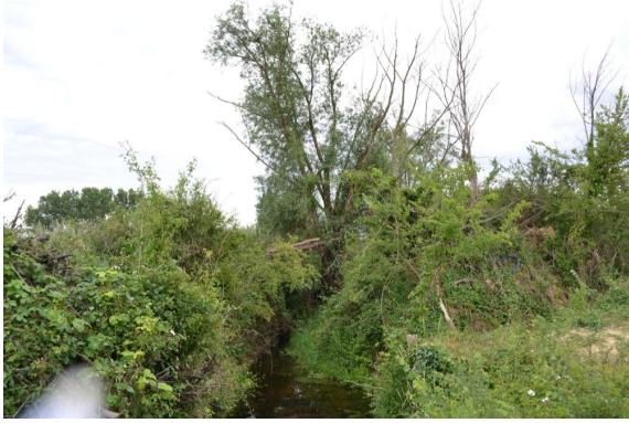
Ripisylve dégradée vers le Gour d'Aigue Blanche.