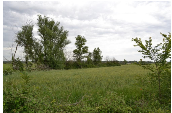
Cordon de ripisylve enrichée vers Joncas.