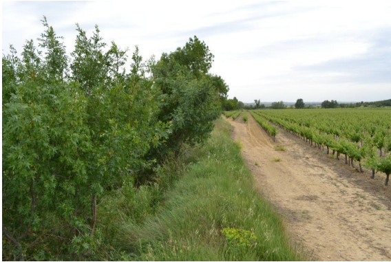
Ripisylve continue vers Gandine.