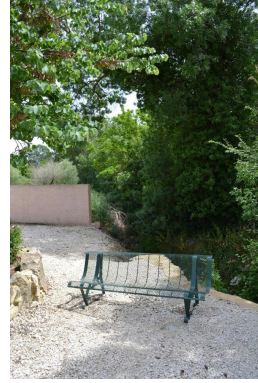
Ripisylve au niveau de la D322 dans le village de Sainte-Eulalie.