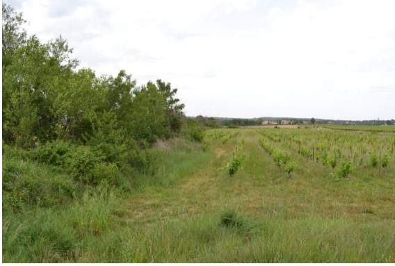
Ripisylve continue en bordure de fossé en amont de l'ancienne voie ferrée vers Gandine.