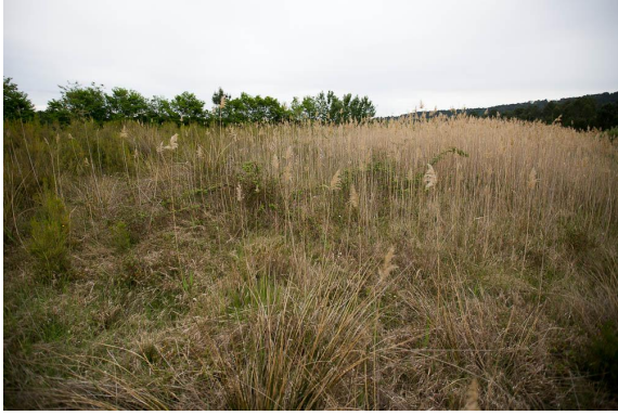
Une roselière mêlée à une lande à Ciste de Montpellier !