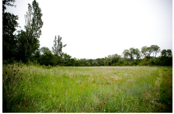
Ripisylve en limite de prairie mésophile.