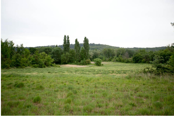
Les grands Peupliers d'Italie marquent l'extrémité de la ripisylve au milieu des prairies de fauche.