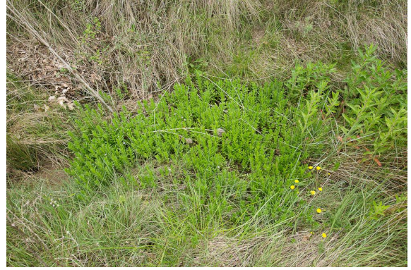
Une tache de Gratiolle officinale au fond du fossé.