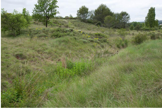
Fossé pentu avec végétation à tendance hygrophile.