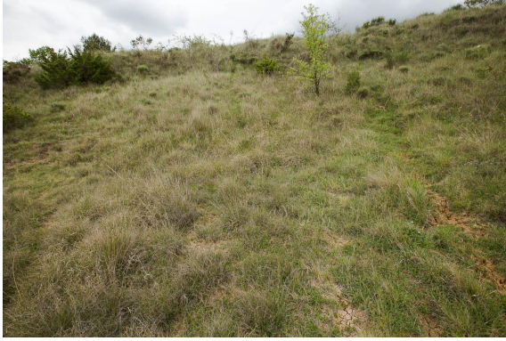
Zone de suintement sur le sol argileux.