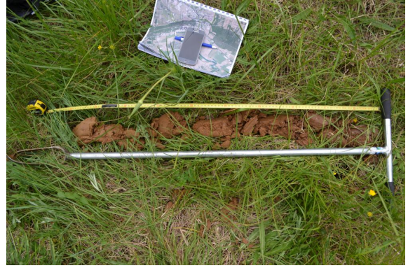
Colluviosol sans traces d'hydromorphie dans le 50 premiers cm - sondage négatif.