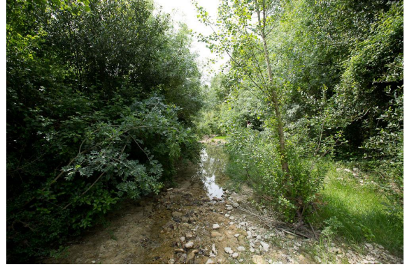
Les Seynes en amont de Labaume, cours d'eau temporaire formant des vasques.