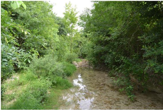
Lit mineur des Seynes en aval du Gour.