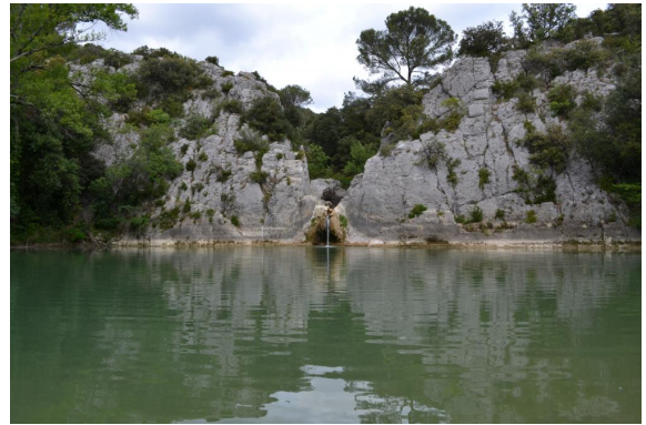
Gour de Conque.