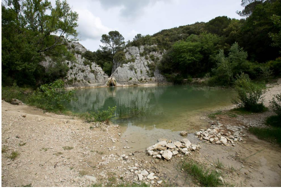
Le gour, en sortie des gorges des Seynes.