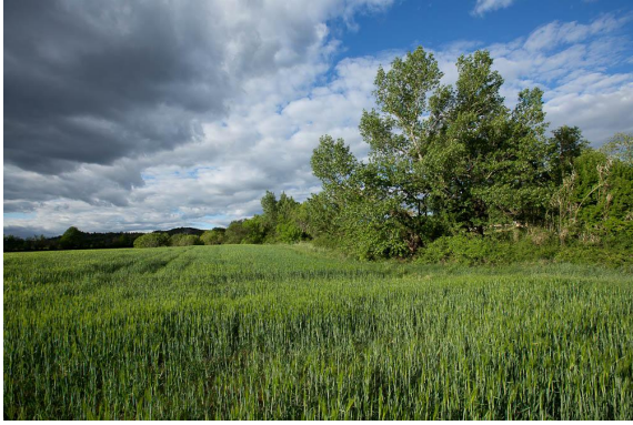
Ripisylve dans la partie aval.