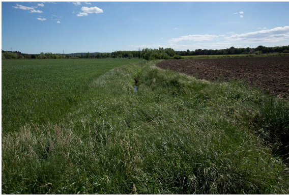
Fossé engoncé entre les parcelles cultivées.