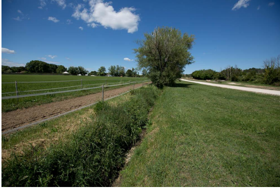
Ripisylve éparses sur fossé avec végétation hygrophile.