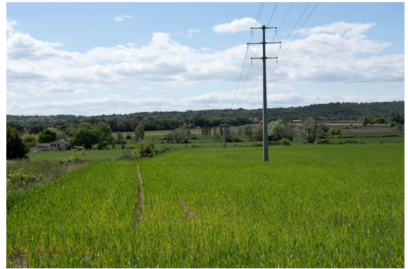
Ripisylve très contrainte en contexte de terres cultivées.