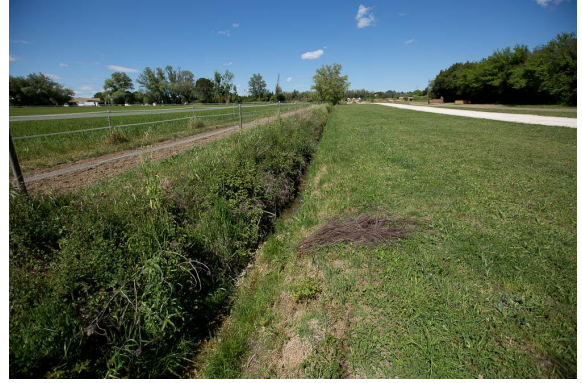
Zone ouverte, toujours en amont.