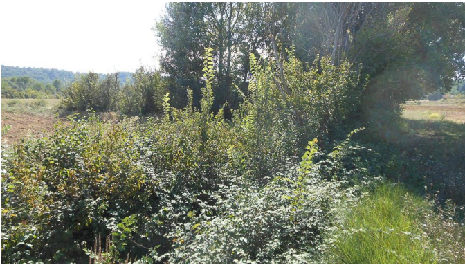
Ripisylve en mauvais état.