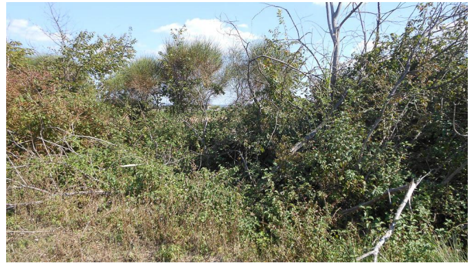
Ripisylve en mauvais état.