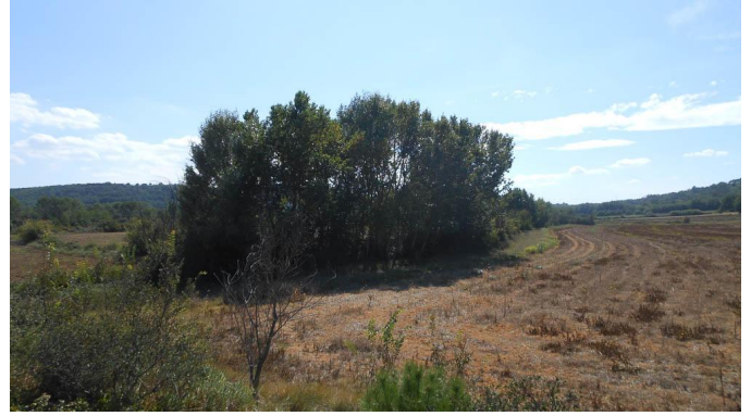
Vue de la ripisylve.