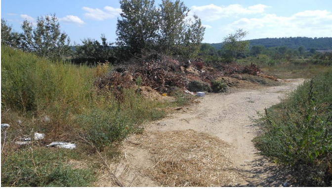
Zone de dépôt.